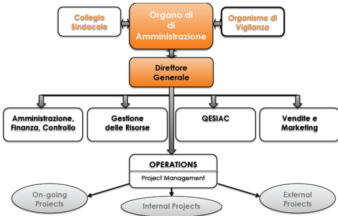
Figura 2 – “Organigramma” aziendale